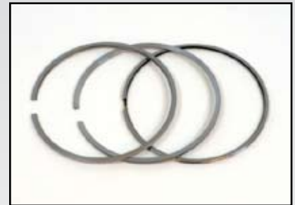
A-23537529 – Juego de Anillos

Comuníquese con nuestros profesionales para aplicaciones exactas.