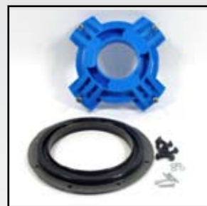
M-4089902 – Jgo – Reten Trasero