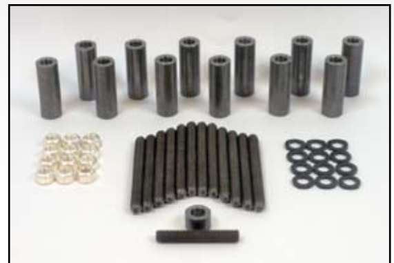
MCBC16ESK – Kit de Espárragos C16

Comuníquese con Interstate McBee para más detalles.