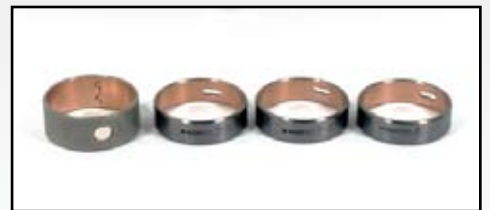
M-1875869C92 – Juego de Bujes de Árbol

Interstate-McBee tiene disponible los juegos de bujes de árbol de levas M-1875869C92 para Aplicaciones de cuatro válvulas en motores Navistar DT466E y DT570E. Este juego nuevo contiene todos los 4 bujes los cuales están marcados para facilidad de instalación y ubicación en el bloque.