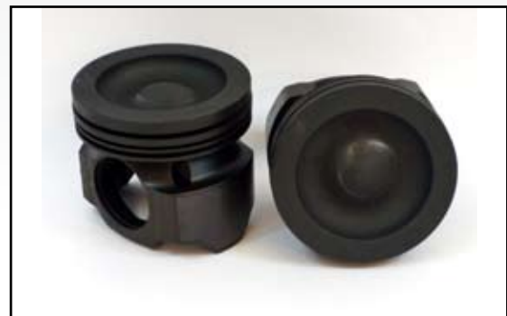
MCB3569946 – Piston C15 Alto Caballaje

Todos los nombres, números, símbolos y descripciones se usan solo como referencia y no implica que estas piezas sean productos de dicho fabricante.