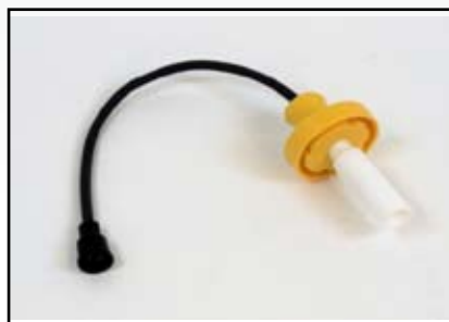
M-7W2479 Alambre de bujía

Interstate-McBee ahora tiene disponible la asamblea de alambre de bujía M-7W2479 para las aplicaciones G3304 y G3306.