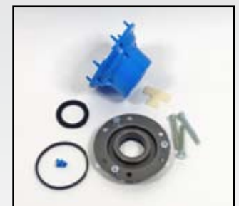
M-3804705 –Reten - Polea de Marcas