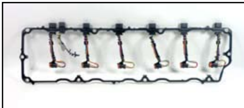
M-1842380C95 – Ensamble Empaque y Arnés

También disponible ahora es el ensamble de empaque de aislador de tapa de válvula con el arnés de inyección integrado M-1842380C95 . Este diseño de todo en uno simplifica la instalación y ayuda a mantener los alambres de inyector organizados para una identificación fácil en caso de algún problema.