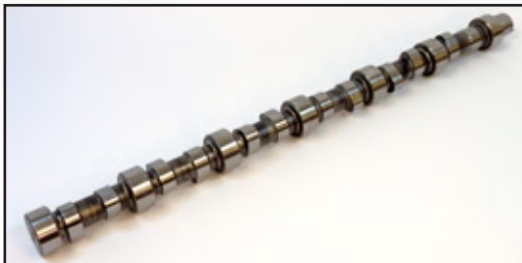
M-3966430 Árbol de levas – ISL8.9 & QSC8.3

Debido al incremento en la demanda, Interstate-McBee ha agregado más a su línea de productos para los motores Cummins® Rango medio y ISL/QSC. Comuníquese con Interstate-McBee para aplicaciones y detalles.