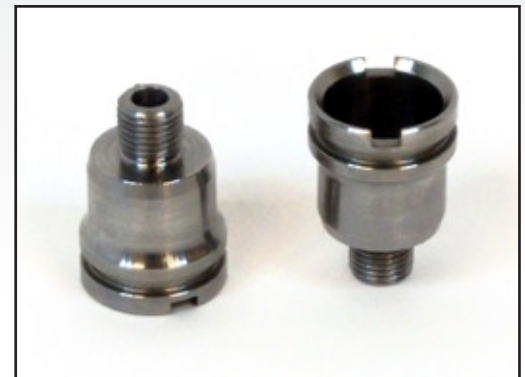
A-23538840 Manga de Inyector Acero Inoxidable

La pieza A-23538840 es una nueva manga de inyector y es un cambio directo del número previo A-23533148. Esta manga de inyector de acero inoxidable se utiliza en los motores con inyectores N3. También se necesita una liga de A-23533147 para asegurar un sellamiento apropiado.