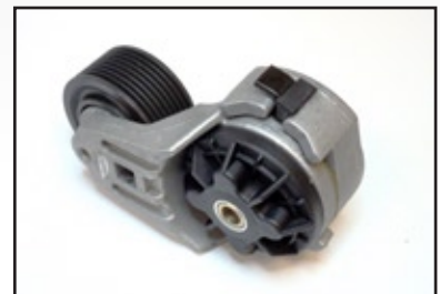
M-3937555 Banda Tensora B & C Serie

Todos los nombres, números, símbolos y descripciones se usan solo como referencia y no implica que estas piezas sean productos de dicho fabricante.