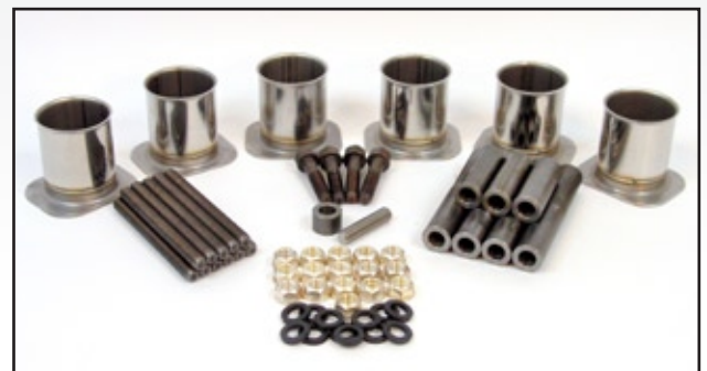
MCB3406CHKT - Juego de Servicio de Cabeza

Todos los nombres, números, símbolos y descripciones se usan solo como referencia y no implica que estas piezas sean productos de dicho fabricante.