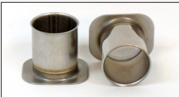
M-1948124 Manga de Escape