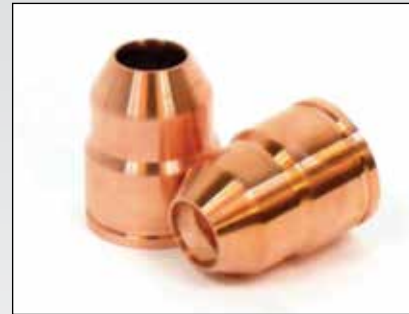
MCB7141 Manga de Inyector

Cuando nuestros clientes hablan, Interstate-McBee les escucha. Ahora presentamos la Manga de Inyector MCB7141 Como alternativa en reemplazo para los motores Cummins® ISX/QSX. El MCB7141 es una manga de inyector fabricado de un aleación de cobre para los modelos de motor antes del 2010 HPCR (Alta Presión Riel Común). Esta manga nueva se puede utilizar en lugar de la manga M-3680873 de acero inoxidable en aplicaciones que tienen dificultades con sellamiento en esta área.