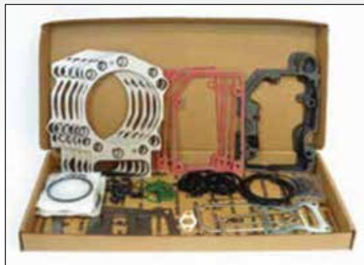
M-4955222 Juego de Empaques Superior

Interstate-McBee amplia nuestro programa de juntas Cummins® con el juego de juntas detallado arriba. Esta nueva adición aumenta nuestra cobertura de los modelos QSK19 hasta la producción actual. El M-4955222 Juego de Empaques Superior incluye la junta de Tapa de Balancín con centro de metal (M-4917451) igual que todas las ligas para los adaptadores de Inyección de Riel Común.