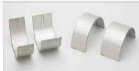
M-2323226 Metales De Biela

Comuníquese con nuestros profesionales para aplicaciones exactas.