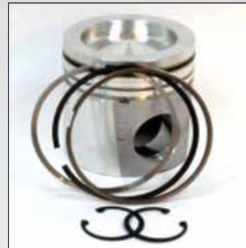
M-4309095 Kit de Piston

Nos complace anunciar la disponibilidad del Kit de Pistón M-4309095 . Este kit incluye el pistón mas actualizado con nuevo diseño en las ranuras de los anillos. También, Interstate-McBee anuncia las reparaciones correspondientes para su conveniencia y el precio que nuestros clientes esperan.